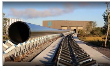
Charleston, South Carolina/USA