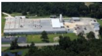
Andrews, South Carolina/USA - Werk II